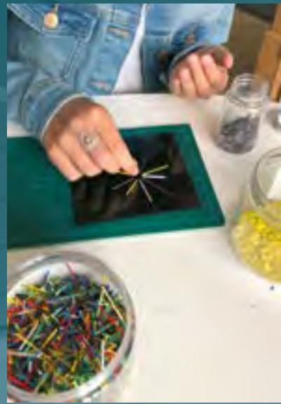
SOMMERFERIEAKTIVITETER, LEG MED GLAS.

Foreningslivet indbydes aktivt til at indgå i konkrete partnerskaber – især inden for velfærdsområdet