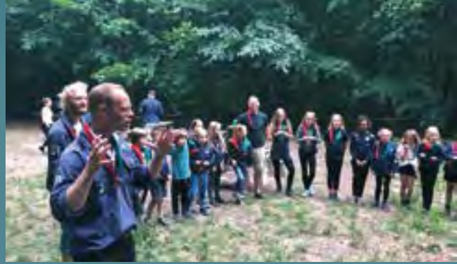
SPEJDERARBEJDE I FURESØ – CLAUDIUS NAR GRUPPE, FARUM. FOTO: RASMUS HOLM JENSEN