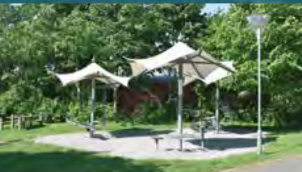
TRÆNINGSPAVILLONER VED FARUM SVØMMEHAL. FOTO: FURESØ KOMMUNE

OLD BOYS, FODBOLD FITNESS PÅ FARUM PARK. FOTO: FURESØ KOMMUNE