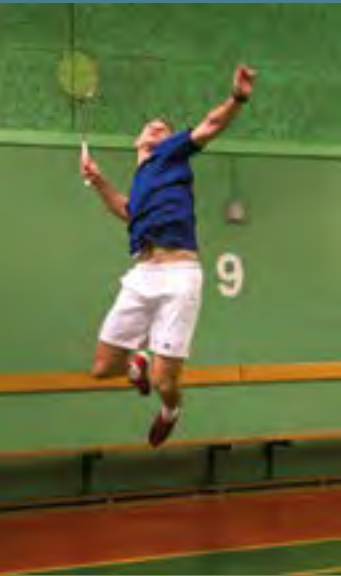
BADMINTONSPILLER I VÆRLØSEHALLERNE.