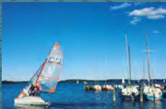
SEJLADS PÅ FURESØEN.