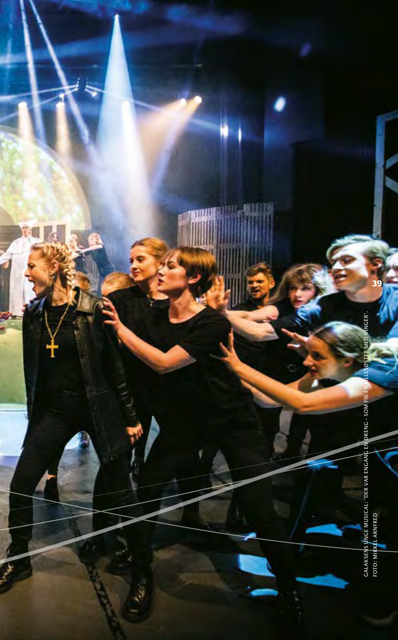
GALAKSENS UNGE MUSICAL: 'DER VAR EN GANG EN DRENG - SOM FIK EN LILLESØSTER MED VINGER'.